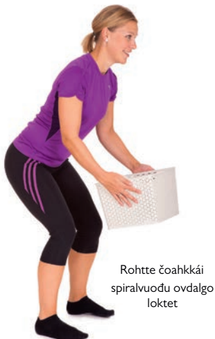
Rohtte čoahkkái spiralvuodu ovdalگو loktet

2. Gease čoahkkái spiralvuodu ovdal go álggát aktivitehtain mii addá deattu čoavjeoažžái ja dahká ahte bahábut dáhpáhuvvá gožžaribaheapmi (ovdamearkka dihte jus loktet, gosat, gasttát, njuiket, viegat, sit-ups: id dagat).