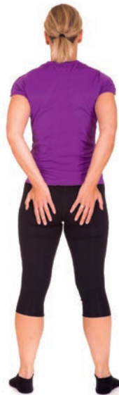
Čuočo nu ahte čoarbbealdeahkit vuoiŋŋastit.

1. Doala juohke čoahkkáigeassima 6–8 sekunda. Jus álggos lea váttis dan dahkat, de álgge oanehit doallamiin ja lasihat optimála dássái juohke hárhjhallamis. Lasit dadistaga man galle geardde geardduhat gitta dassáži go veaját 8–12 geardde geardduhit. Hárjehala golbma hárhjhallanráiddu juohke beavvi. Hárjehallama sáhtát ovddidit nu ahte dagat golbma hoahpus čoahkkáigeassima loahpageahčen dan áiggis go leat doallame sisa dehkiid. Don sáhtát golbma hárhjhallanráiddu dahkat maŋŋalaga mas lea oanehis bottoš gaskkas juohke ráiddu maŋŋil, dahje sáhtát dahkat hárhjhallanráidduid beavvi guhkkodaga mielde. Daga nu mo šaddá buoremus kvalitehta, ja mii heive du bargo- ja eallindillái.