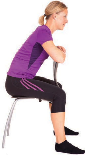
Čohkkát stuolus ja hářčát, ja gardnjiliiguin mieigat stuolločielggi vuostá.

Spiralvuodu hárhállan ii leat váttis eaige das leat liige-váikkuhusat. Don fertet hárhállat rivttes ládje, beaktilit ja systemáhtalaččat guhkes áiggi. Sáhtta ádjánit 3 -6 mánu áigge ovdalگو albma ávki dovdo. Jus ii ovdán, dahje don eahpidat hárhállat go rivttes ládje, de berret doaktáriin gulahállat vai son guorahállá ja hutká doaimmabijuid. De don sáddejuvvot fysioterapeuta lusa geas lea spesialgelbbolašvuohhta dán suorggis. Fysioterapeuta veahkeha heivejit individuála hárhállan-programma, ja vaikko lassi veahkkeneavvuid nu go biofeedback dahje elektrostimulereima.