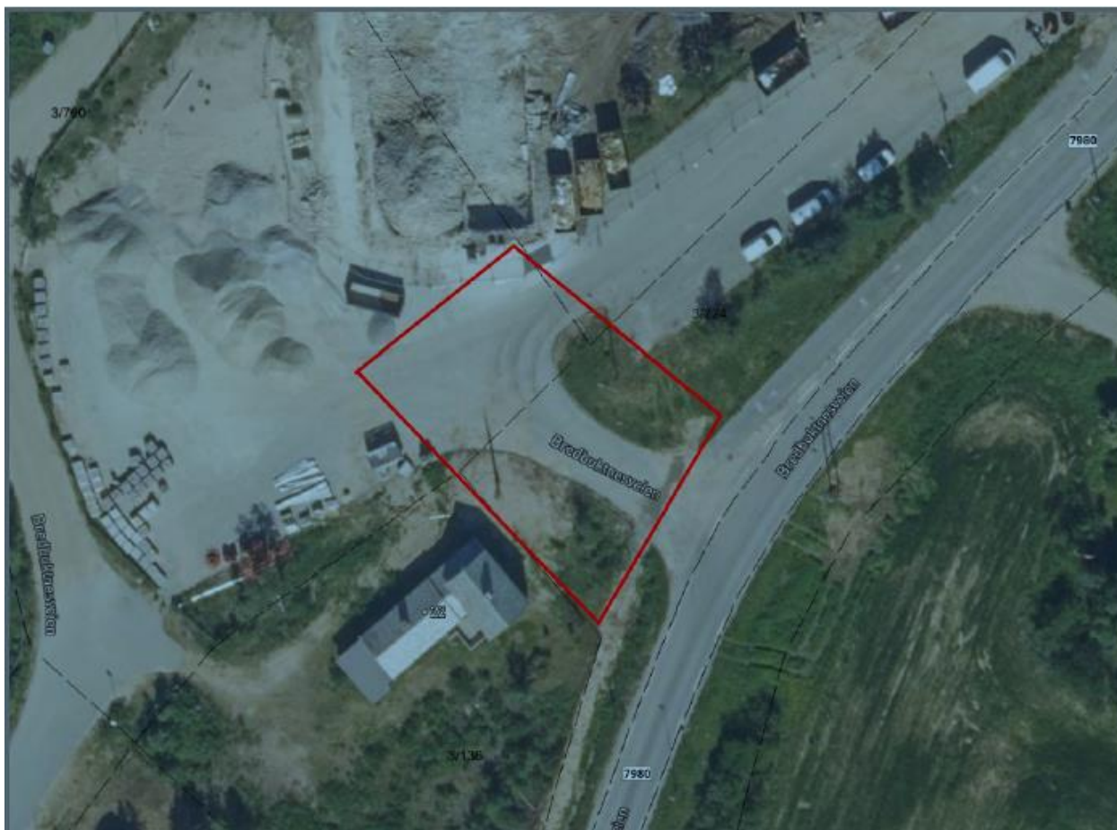
Figure 2 Kommunen har ikke oppdaterte flyfoto over området. Flyfotoet er under bygingsfasen

Kommunestyret har vedtatt at vegen til eiendommene 3/1/52, 3/1/29 og 4 boenheter på 3/790, skal stenges jf Detaljregulering for Kautokeino skole. Planendringen vil kunne åpne opp for at eksisterende boliger/eiendommer vil kunne ha adkomst. Det er i tillegg 1 ubebygde eiendom nærmest E45, som i dag ikke har adkomst, som vil kunne få adkomst med en planendring. Eksisterende eiendommer har en eksisterende veg, men er i reguleringsplanen regulert til gang- og sykkelveg (på figur 3 er det merket med o_GS2).