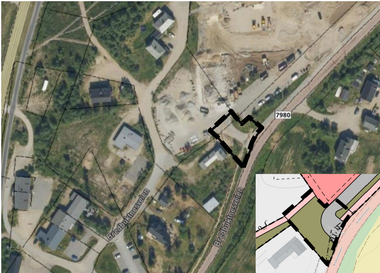
Figur 1. Hovedfigur viser ortofoto med angivelse av forslag til planområde for mindre reguleringsendring i sort stiplet linje. Figur nede til høyre viser utsnitt fra gjeldende reguleringsplan med angivelse av areal som omfatter denne endringen i stiplet linje.