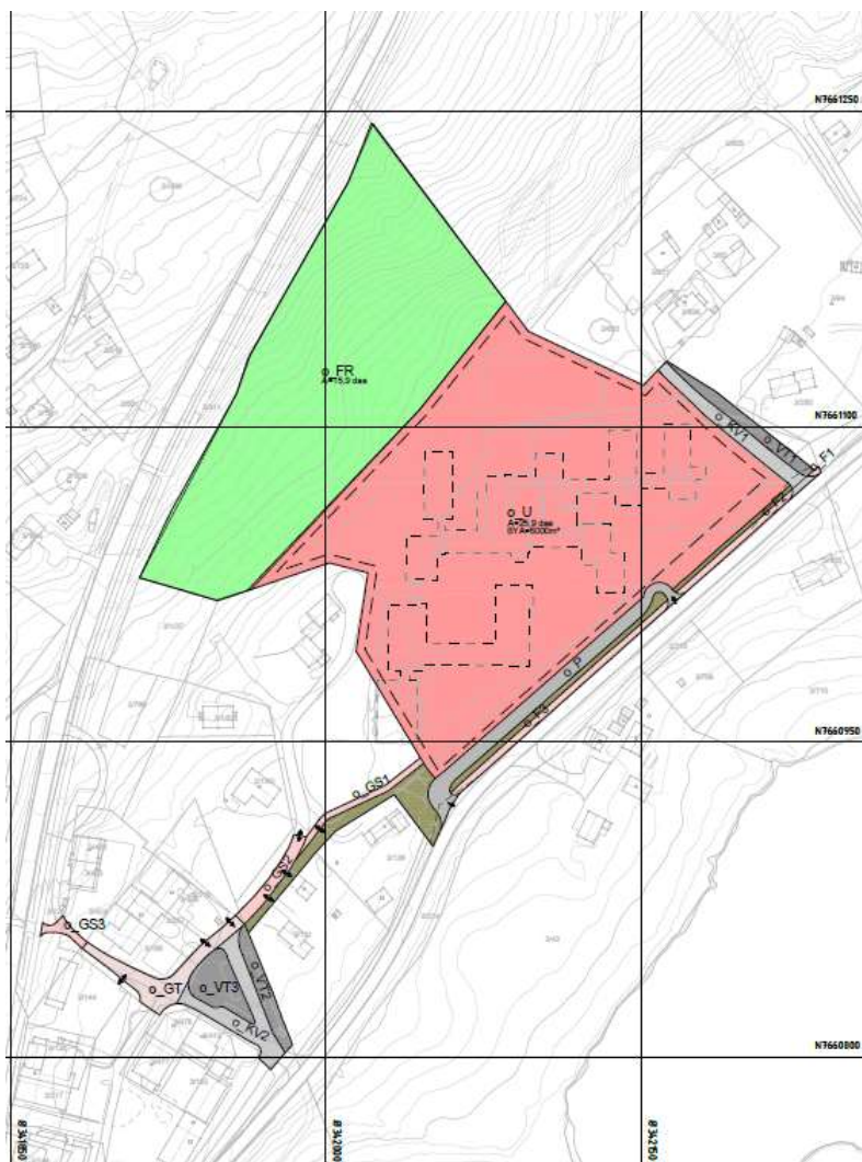
Figur 3- Utsnitt som viser planforslaget. Se også vedlegg A1.

I tillegg er plankartet levert i digitalt kartformat (SOSI-fil).